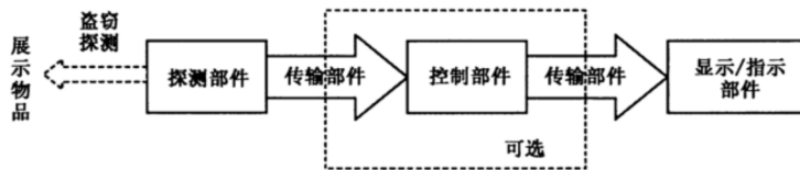
图 1 单路式防盗装置组成原理图